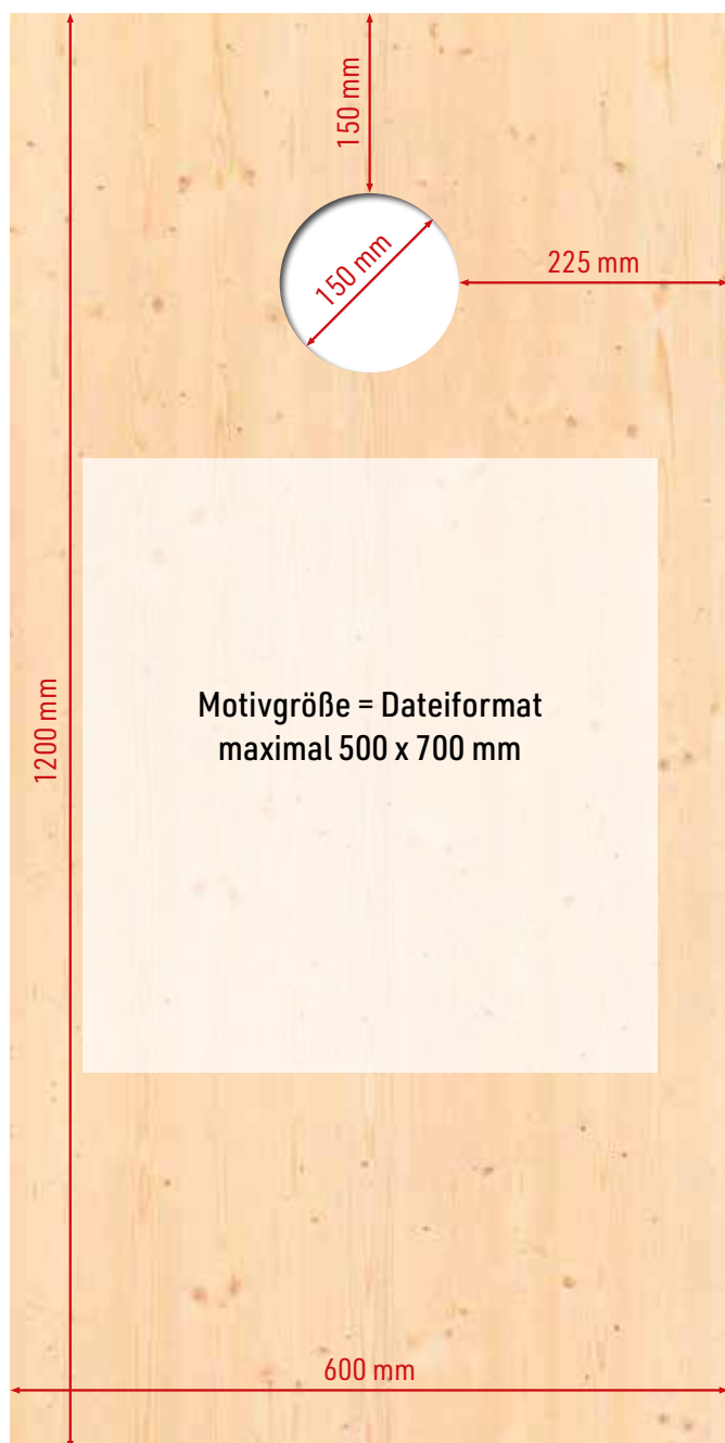
Boardgröße 600 x 1200 mm